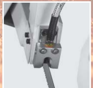
Einsatz bei Bandsägemaschinen