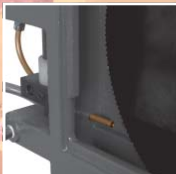
Einsatz bei Kreissägemaschinen